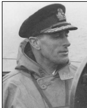
Lord Louis Mountbatten på HMS Kelly

Indledende overvejelser af større commando angreb på den franske kyst var i fuld gang, og natten efter d. 23. november, bare fire uger efter Mountbattens kommandoovertagelse, landede en gruppe på 88 soldater fra 9. Commando på stranden ved Houlgate i Normandiet. Det var et angreb i lille skala, men det viste store problemer med radiokommunikationen mellem landstyrken og skibene på havet. Det var et problem, som ville fortsætte i måneder derefter.