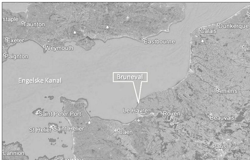
Bruneval ligger nordøst for Le Havre

med fotografier af de dele, der ikke kunne flyttes og tages med.