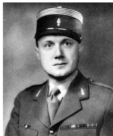
Gilbert Renault alias Remy

En dag traf han de Gaulle på trappen i dennes hovedkvarter og fortalte ham, at han var rede til at lede en hemmelig mission til Frankrig. Generalen vendte sig mod ham, trykkede ham i hånden og sagde: Farvel, Raymond. Jeg stoler på Dem. 9 Gilberts dæknavn var på daværende tidspunkt Raymond.